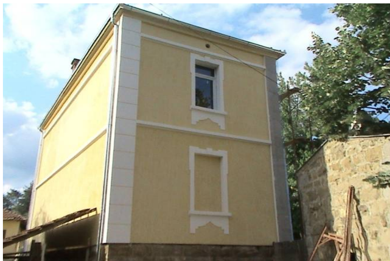
Žlne, jedan od zaboravljenih bisera Stare Planine