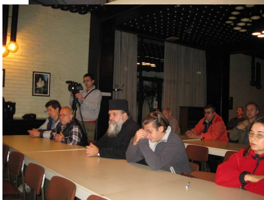
Обновљиви извори у свету 2005